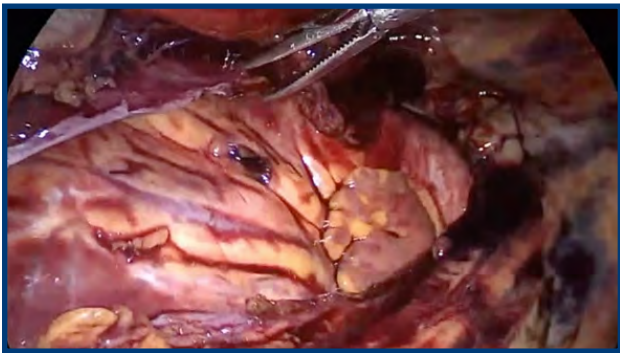
FIGURA 2. Herida de infundíbulo subpulmonar.