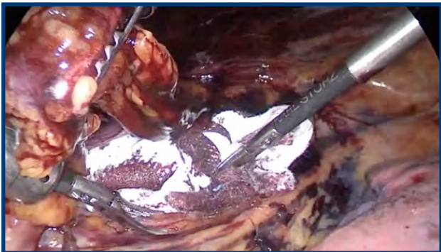
FIGURA 3. Compresión mecánica con gasa.

El paciente fue extubado en quirófano y trasladado a la unidad de cuidados intensivos. Permaneció hemodinámicamente estable con bajo débito por los tubos de drenaje pleural.